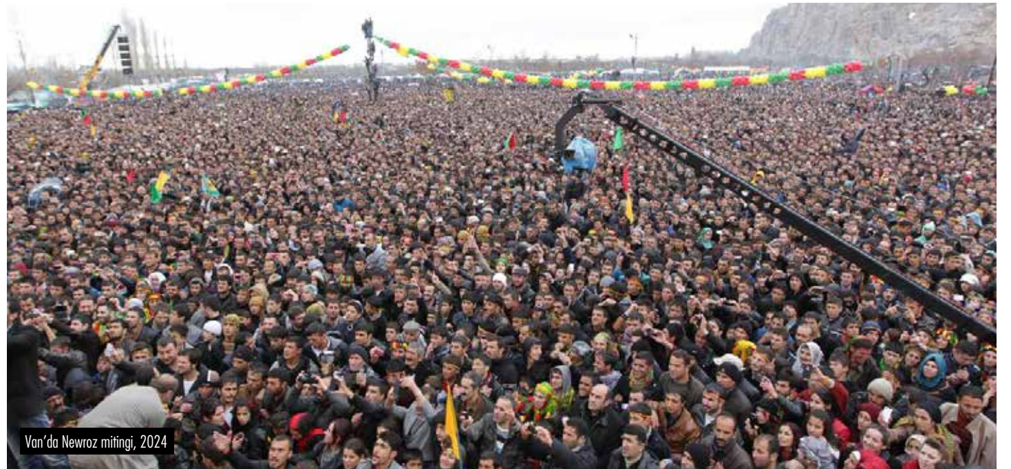
Van'da Newroz mitingi, 2024

Fakat emperyalist ülkelerin çatlaklarından yararlanarak bölgesel bir güç olmaya çalışma stratejisi "birçok krizi aynı anda