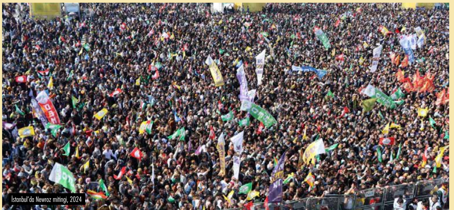
Istanbul'da Newroz mitingi, 2024

Son olarak, barış mücadelesiyle kapitalizme karşı mücadelenin arasında doğru bağlantılar kuramazsak, örneğin barışın gerçekleşmesini kapitalizmden kurtulduktan sonra mümkün görürsek çok doğru bir tutum almış oluruz. Şu anda, daha çatışan güçlerin ilk temaslarının gerçekleştiği bir evredeyiz. Diyalog-müzakere-çözüm süreci diyebileceğimiz aşamalara daha çok vakit var. Burada en önemli risk, "terörü bitirmek" adı verilen ve 40 yıldır denenen politika denenecekse bunun çözümle uzaktan yakından ilgisi olmayacağını görmektir. Hamasetle yol almak mümkün değildir. Gerçekçi bir barış politikası için hepimizin harekete geçmeye mecbur olduğumuz bir dönemden geçtiğimizi ve bıkmadan usanmadan bugüne kadar anlattıklarımızı anlatmaya devam etmemiz gerektiğini görmek lazım. Şimdi bir fırsat şekillendi, değerlendirip değerlendirmemek bize, barış güçlerine düşüyor.