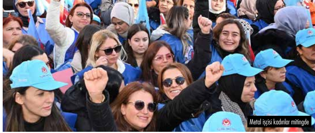
Metal işçisi kadınlar mitinginde

Son yılların en büyük işçi eylemi Türk-İş'in çağrısıyla Ankara'da gerçekleşti.