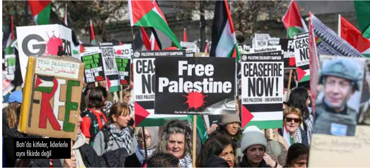
Batı'da kitleler, liderlerle aynı fikirde değil