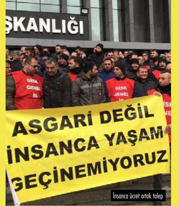
İnsanca ücret ortak talep

Erdoğan temmuzda asgari ücrete ara zam yapılmayıp ücretlerin yılbaşında iyileştirileceğini vaat etmişti.