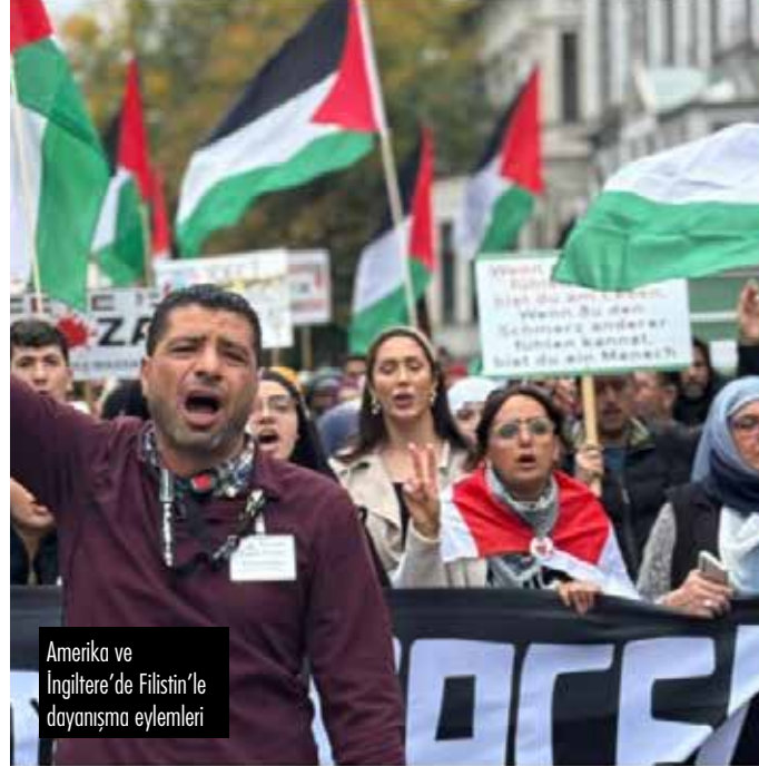
Amerika ve İngiltere'de Filistin'le dayanışma eylemleri

ABD'de İsrail destekçisi Joe Biden ya da savaş karşıtlarının taktığı ismiyle "soykı-