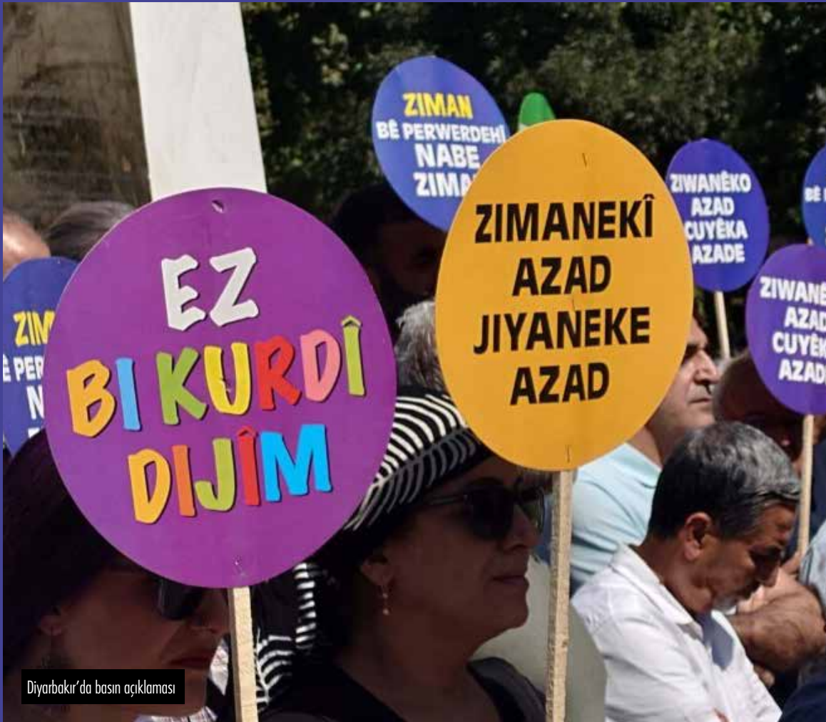
Diyarbakır'da basın açıklaması