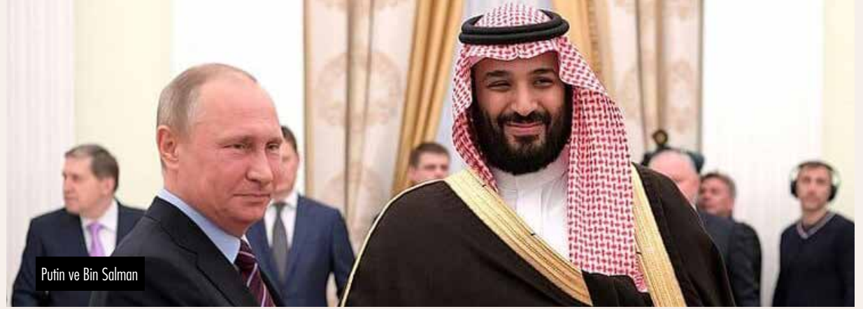
Putin ve Bin Salman