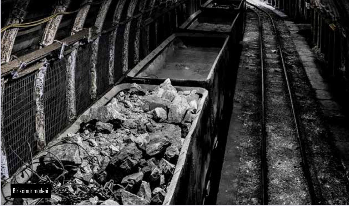
Bir kömür madeni

Dünyadaki kömür üreticisi ülkelere bakıldığında, maden kazaları artık nadiren yaşanan bir duruma döndü. Türkiye’de ise madenler sürekli işçilere mezar oluyor.