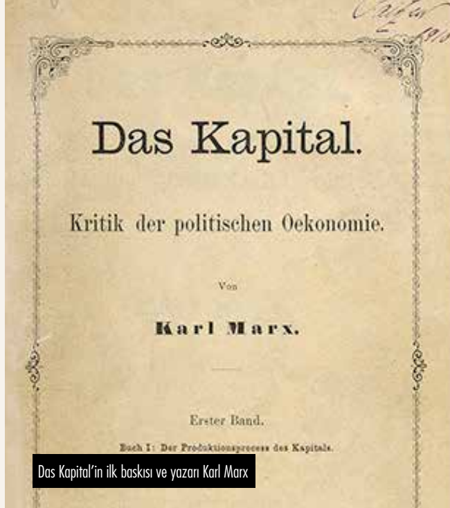
Das Kapital'in ilk baskısı ve yazarı Karl Marx

Bundan sadece iki yıl sonra Ekonomik ve Felsefi El Yazmaları'nda daha sonra geliştireceği ekonomi politığın ilk adımlarını