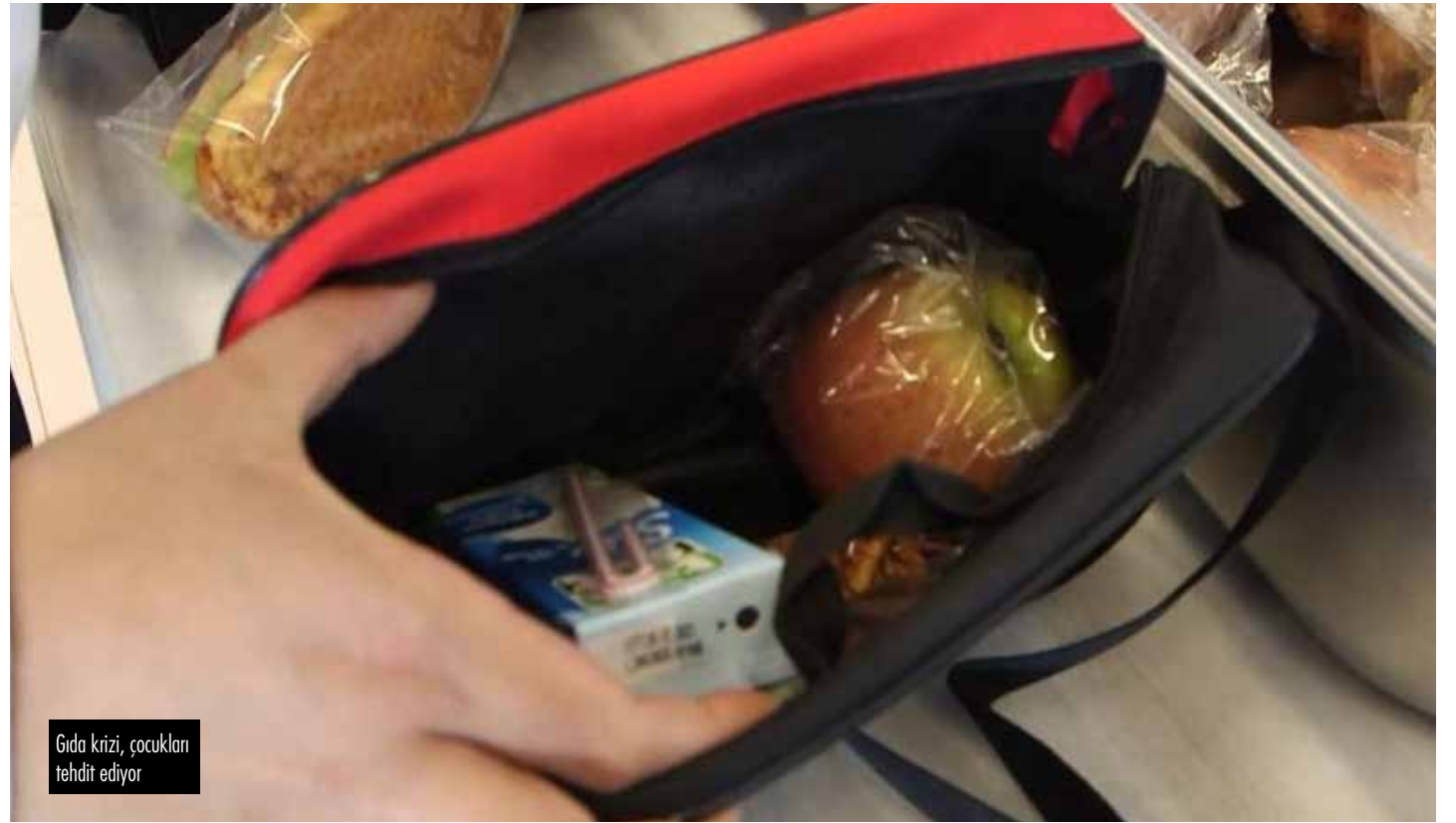
Gıda krizi, çocukları tehdit ediyor

Artan özel okul sayıları ile devlet okullarının gün geçtikçe niteliksiz ve donanımsız hale gelmesi de eşitsizliğin artmasına ne-