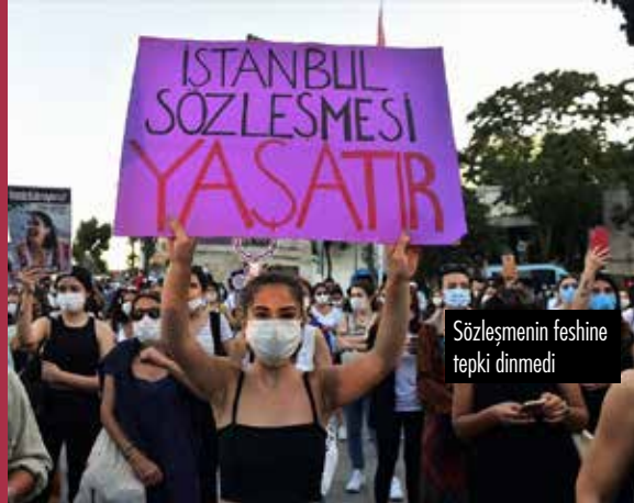
Sözleşmenin feshine tepki dinmedi

Yeniden Refah Partisi Cumhur İttifakı'na katılmak için 6284 Sayılı Kanun'un kaldırılmasını şart koşmuştu. AKP'li Aile ve Sosyal Hizmetler Bakanı Derya Yanık ve AKP Grup Başkan Vekili Özlem Zengin bu pazarlığa karşı çıkmışlardı. Zengin, "6284 kırmızı çizgimizdir" demişti.