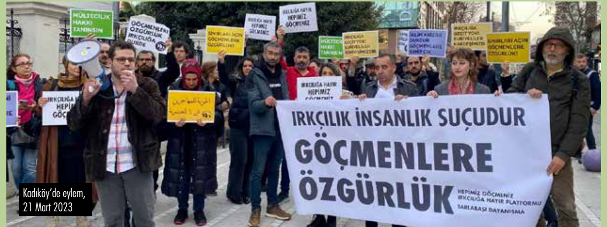
Kadıköy'de eylem, 21 Mart 2023

Uluslararası Irkçılıkla Mücadele Günü 21 Mart'ta Kadıköy'de bir basın açıklaması yapan Tarlabası Dayanışma ve Hepimiz Göçmeniz Platformu göçmenlerle dayanışmanın önemine vurgu yaptı.