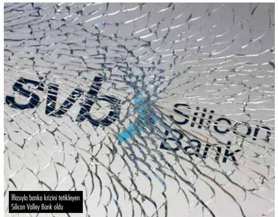
İflasıyla banka krizini tetikleyen Silicon Valley Bank oldu