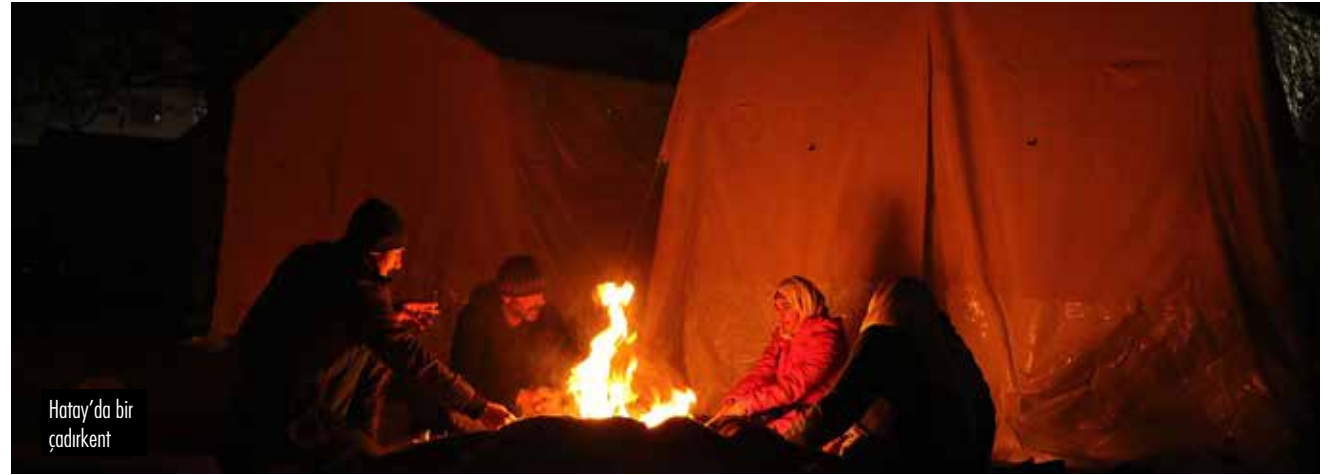
Hatay'da bir çadırkent