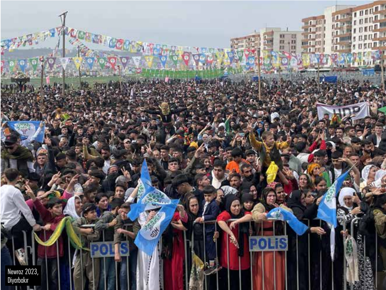
Newroz 2023, Diyarbakır

“Ezen ulusun demokratlarının, sosyalistlerinin ezen ulusun demokratları ve sosyalistleri olduğunu unutmaması gerektiğini hatırlatmak istiyoruz. HDP ile kurulan ilişkinin milletvekilliği tartışmalarının ötesine geçmesi ve hem seçimden önce hem seçimlerden sonra oluşacak siyasal şekillenmede tüm ezilenlerin birlikte direniş imkanlarını geliştirmek açısından ele alınması gerektiğini düşünüyoruz.”