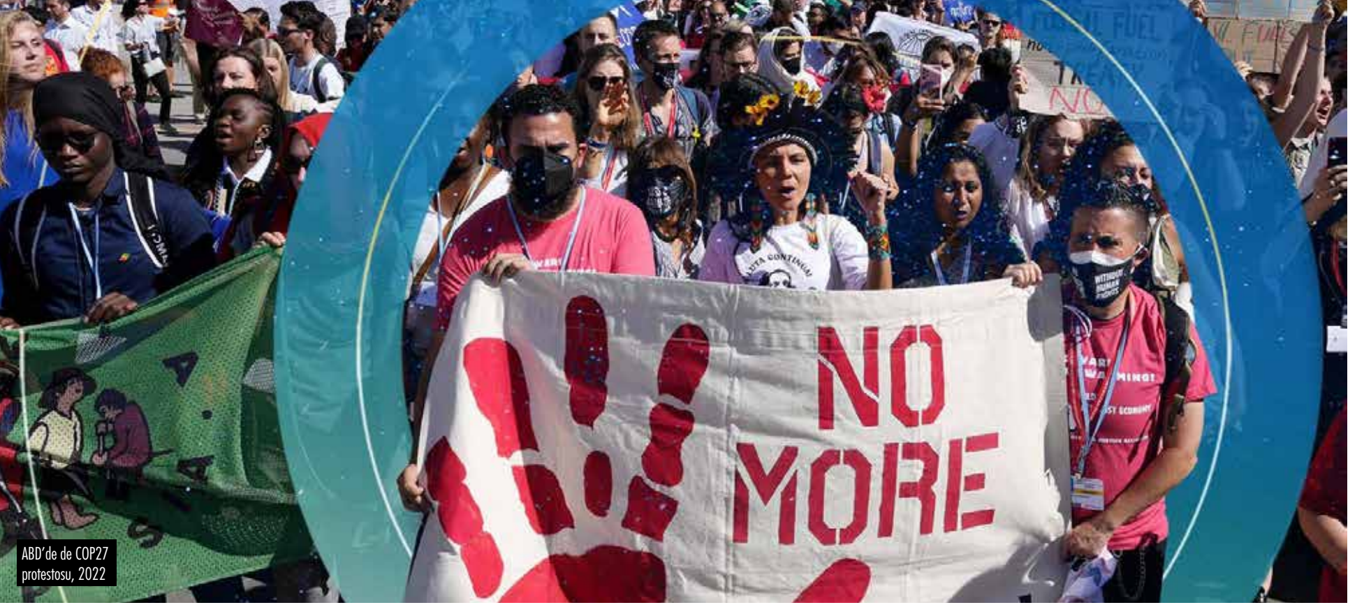
ABD'de de COP27 protestosu, 2022