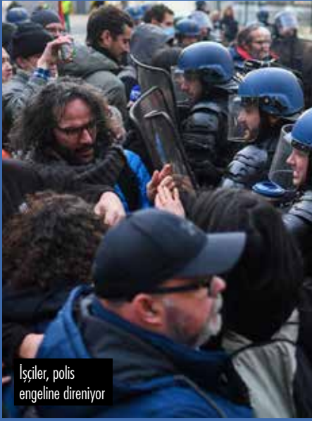
İşçiler, polis engeline direniyor

Neoliberal Macron'un emeklilik yaşını 62'den 64'e çıkartma girişimine karşı Ocak ayında başlayan protesto dalgası kitleselleşerek devam ediyor.