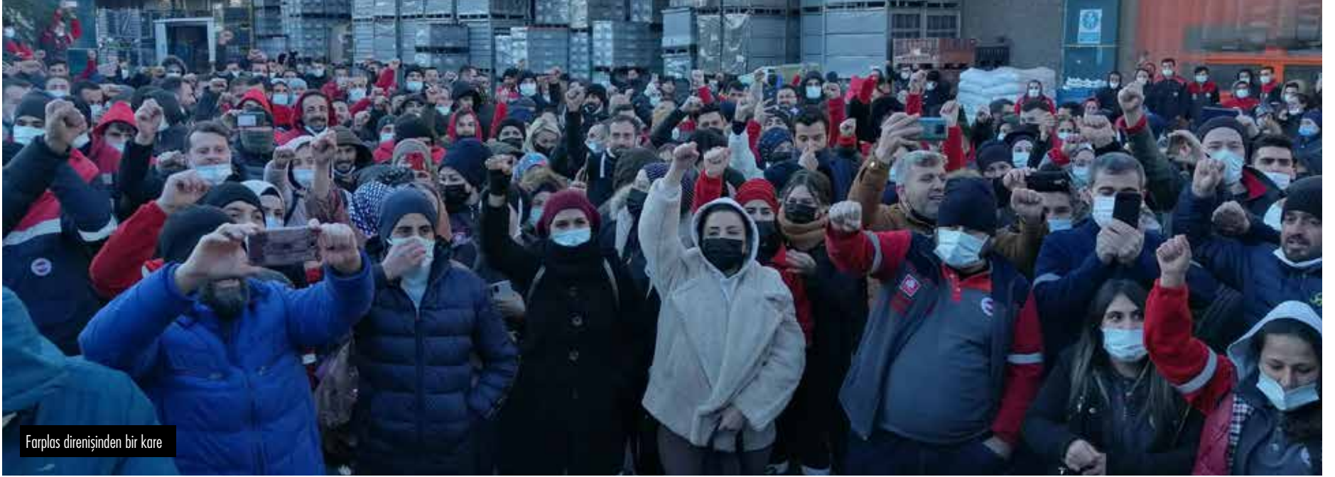
Farplas direnişinden bir kare

Rusya'nın Ukrayna işgali, pandeminin defolarını açık seçik ettiği kapitalist sistemin özünde bir katliam ve bir açlık krizi anlamına geldiğini gösteriyor. İşgalde binlerce Ukraynalı öldürülürken, savaş küresel bir gıda krizini şimdiden tetiklemiş vaziyette. Birleşmiş Milletler Gıda ve Tarım Örgütü Gıda Fiyat endeksi Şubat ayına göre yüzde 12.6 artışla Mart ayında 159,3'lük rekor bir seviyeye ulaştı.