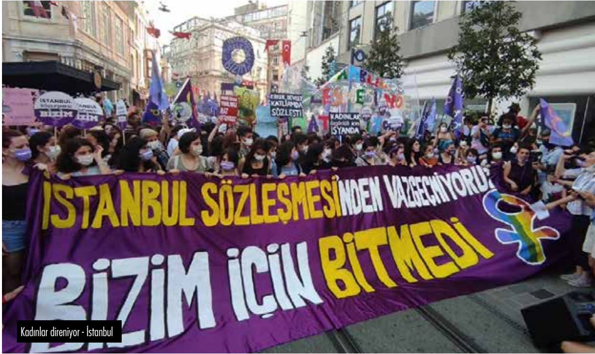
Kadınlar direniyor - İstanbul