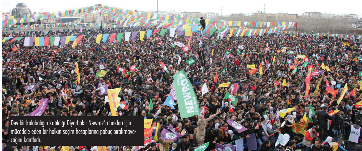
Dev bir kalabalığın katıldığı Diyarbakır Newroz'u hakları için mücadele eden bir halkın seçim hesaplarına pabuç bırakmaya-çağını kantladı.

Emin olalım ki iktidar bloku liderleri hem 20 Newroz kutlamasına hem de 21 Mart akşamı yapılacak Diyarbakır Newroz'una bakıp kara kara düşünüyorlardır. Her bir gelişmenin nedenleri hakkında keskin bir politik bilince sahip olan bir halkın siyaseti etkilemesinin önüne seçim mühendislikleriyle geçilemez!