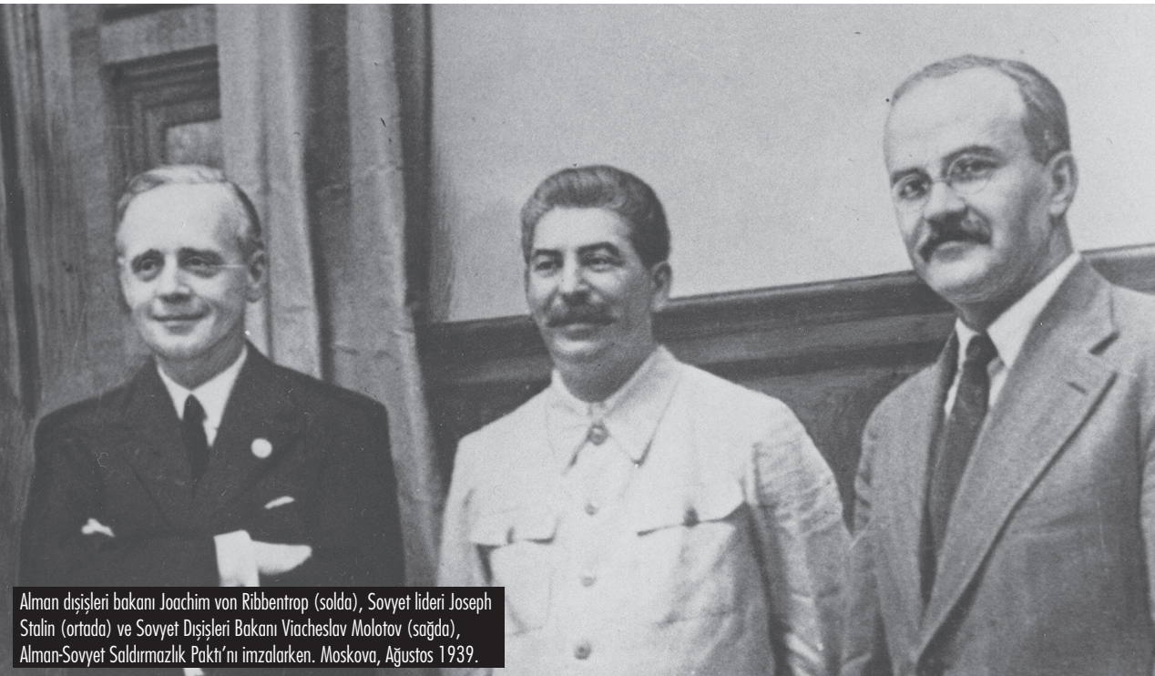
Alman dışişleri bakanı Joachim von Ribbentrop (solda), Sovyet lideri Joseph Stalin (ortada) ve Sovyet Dışişleri Bakanı Vyacheslav Molotov (sağda), Alman-Sovyet Saldırmazlık Paktı'nı imzalarken. Moskova, Ağustos 1939.

Rusya Dış İşleri Bakanı Sergey Lavrov aralarında kadın ve çocukların olduğu binlerce sivilin ölümüne, milyonlarcasının da yerinden edilmesine yol açan bombardımanla, Rusya topraklarına yönelik her türlü tehdidi ortadan kaldırmayı hedeflediklerini söyledi. Kendi sınır güvenliğini korumak için başka ülkeleri işgal etmek, ABD'nin Afganistan ve Irak'ı işgali esnasında Bush tarafından dile getirilmişti. Türkiye'de Libya ve Suriye'ye yapılan müdahalelerde benzer politikalar geliştirdi. ABD dünya üzerindeki sarsılan hegemonyasını yeniden kurmak için dünyanın pek çok yerinde sürmekte olan savaşın başlatıcısı. Ancak ABD emperyalizmi teşhir edilirken, Rusya ve Çin'in emperyalist doğaları göz ardı edilmekte, eski Rusya'nın yer aldığı nüfuz alanları ve Çin'in Hongkong ve Tayvan gibi nüfuz alanları iki ülkenin arka bahçesi olarak kabul edilmekte. Rusya'nın ve Çin'in nüfuz alanlarını genişletmeye yönelik hamleleri göz ardı edilmekte. Oysa bu savaş milyonlarca Ukraynalının dışında, milyonlarca emekçinin yaşamını doğrudan etkilemekte. O nedenle amasız, fakatsız, Rusya'nın Ukrayna'yı işgaline karşı çıkmak zorundayız.