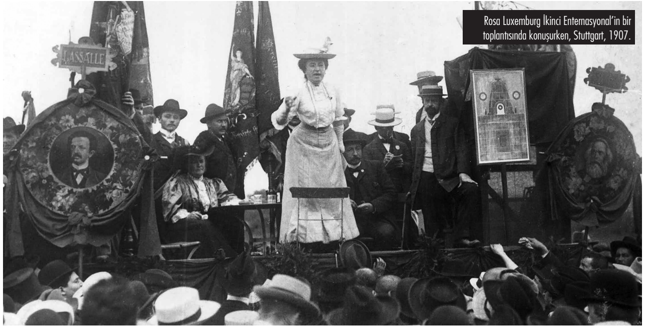
Rosa Luxemburg İkinci Enternasyonal'in bir toplantısında konuşurken, Stuttgart, 1907.

Rosa'nın Bolşeviklere eleştirileri vardı. Örneğin Kurucu Meclis'i kapatmalarına karşıydı. Fakat Alman Devrimi'nin deneyimleri ona tam aksini gösterdi. Almanya'da reformistler bir Ulusal Meclis'in toplumu yönetmesi fikrini savunuyorlardı. Rosa bunun "devrimci proletaryaya karşı kurulmuş karşıdevrimci bir kale" olduğunu dile getiriyordu.