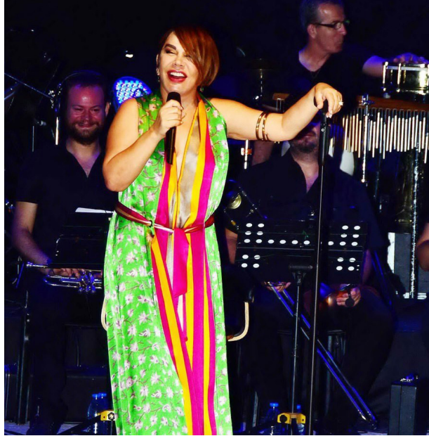
Sezen Aksu, 2002 yılında Diyarbakır'da Newroz mitinginde de sahne almıştı. Sonrasında çözüm sürecinde, barış için sivil inisiyatiflerin de harekete geçmesi gerektiğini söyledi.

İstanbul Sözleşmesi'ne, kadınların en küçük bir hakkının bile olmasına karşı çıkan maçoğlar güruhu, bin bir yalanla kamuoyu yaratıp, minik bir azınlık da olsalar iktidarın karar merkezlerini harekete geçirebildiler. Şimdi Sözleşme'den çekilmekle yetinmiyorlar, kadınların haklarını güvence altına alan somut yaptırımları tarif eden 6284 numaralı yasa maddesinin iptali için bastırıyorlar.