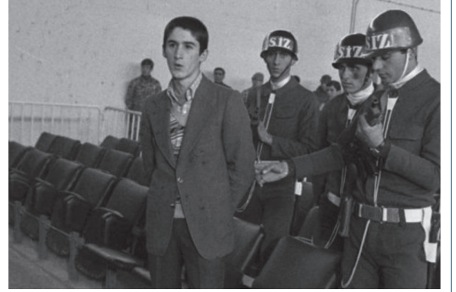
12 Eylül askeri darbesinin yaşını küçülterek aştığı Erdal Eren için, sözlerini Aysel Gürel'in yazdığı bestesini Onno Tunç'un yaptığı Son Bakış şarkısını Sezen Aksu Söylüyor albümünde yer almaktadır.

devam etmesi gibi hedeflediğinin tam tersi sonuçlara yol açacağını bile iktidar bu nobran tutumunu devam ettirecek. 800 bin oy fark yiyeceğini fark edmeden İstanbul seçimlerini tekarlatacak, Kürtleri daha da birleştireceğini fark etmeden Edirne'yi İmralı'ya şikâyet edecek, AKP'ye oy veren yüzbinlerce kadının tepkisinin ne olduğunu ölçmeden İstanbul Sözleşmesi'nden çekilecek, hayvanları seven, sokak hayvanlarının rahatı için canını verecek yüzbinlerce