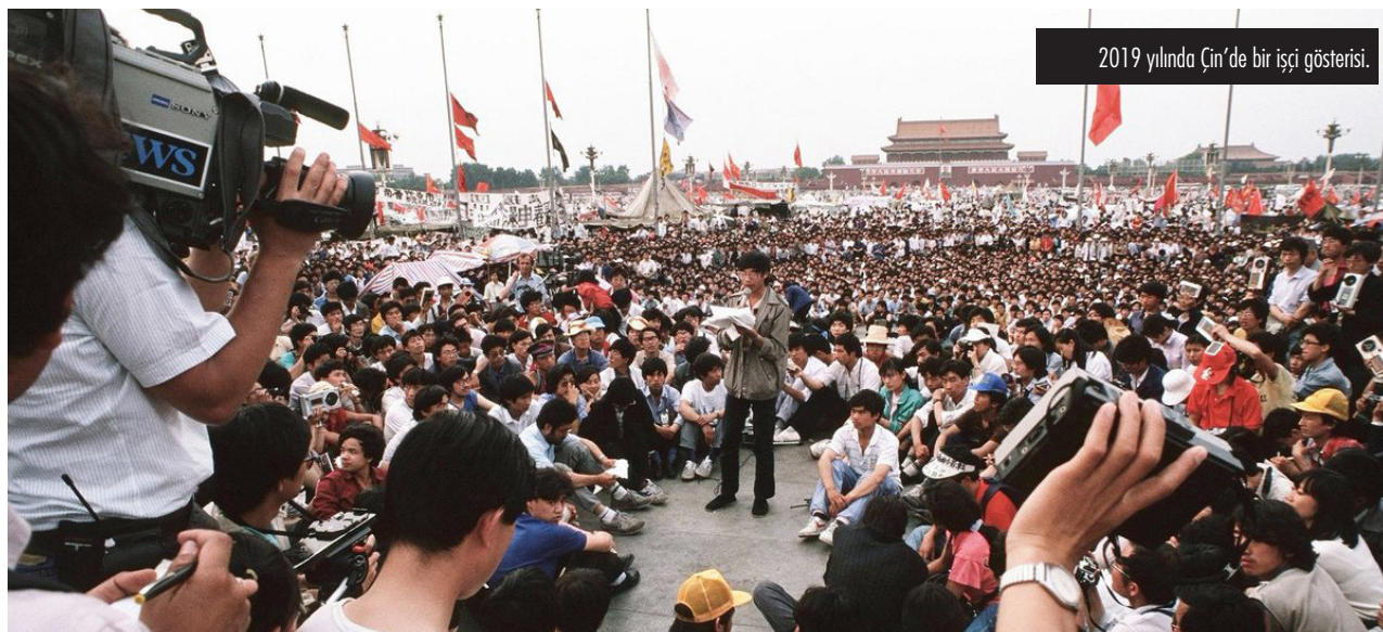
2019 yılında Çin'de bir işçi gösterisi.

Batıda krize karşı derinleşen işçi sınıfı öfkesi, bu halkla dayanışmanın önemini bütünüyle kavradığında ve bu dayanışmayı seçim ittifakı için yan yana gelmenin ötesinde antikapitalist bir mücadelenin birlikte örülmesi olarak ele aldığında çok daha radikal bir demokratik hamle yapmış olacaktır.