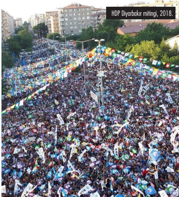
HDP Diyarbakır mitingi, 2018.

Bu açıdan Türk-İş başkanının göçmen işçilerle ilgili söyledikleri birleşik mücadele ruhuna bütünüyle aykırı. Atalay, “İki ayakkabı fabrikası var. Biri Suriyeli, Afgan çalıştırıyor. Diğeri asgari ücret, servis ve yemek parası veriyor. Maliyet birinde 5 bin 700 TL, diğerinde 2 bin TL. İrkçi değilim. Ben Türkiye’den yanayım” diyor. Atalay bir sendikacı olarak göçmen işçilerin aldığı düşük maaşa karşı çıkması gerekirken göçmen işçilerle Türkiyeli işçiler arasında yapay bir bölünme ekliyor. Savunulması gereken göçmen işçilerin de diğer işçiler kadar maaş alması ve aynı hakları sahip olmasıdır.