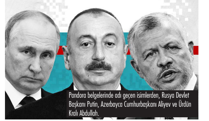
Pandora belgelerinde adı geçen isimlerden, Rusya Devlet Başkanı Putin, Azerbaycan Cumhurbaşkanı Aliyev ve Ürdün Kralı Abdullah.

Devletler ve hükümetler onlara hiçbir yaptırım uygula-