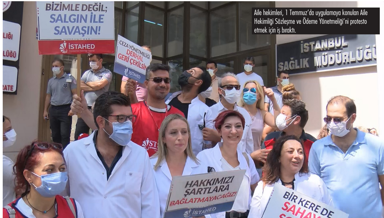
Aile hekimleri, 1 Temmuz'da uygulamaya konulan Aile Hekimliği Sözleşme ve Ödeme Yönetmeliği'ni protesto etmek için iş bıraktı.

Artan hayat pahalılığı ile başa çıkamayan emekçiler borçla yaşıyor. 34 milyon kişi bankalara borçlu durumda, 3 buçuk milyon kişi ise borcunu ödeyemediği için problemli durumda. Mutfaktaki yangını söndüremeyen emekçiler bankalarla yaptıkları kredi anlaşmalarıyla market alışverişi yapıyorlar. Yani zaten küçük miktarda olan ücretler de bankaların ipoteği altında.