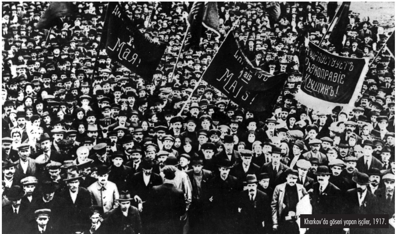
Kharkov'da göseri yapan işçiler, 1917.

Ekim Devrimi'nin gerçekleşmesinde en önemli faktör ise hiç kuşkusuz işçi sınıfı mücadelesi içerisinde yıllar boyu yer almış militanların oluşturduğu devrimci bir partinin varlığıydı. Benzer bir partinin inşa edilemediği durumda, 1918-1923 arası Almanya'da çok daha kitlesel bir işçi hareketi olmasına rağmen devrim başarı kazanamadı. Sosyalist İşçi gazetesinin altında yatan fikir de bu; bugünün Ekim Devrimi'ni inşa edebilecek öncü aktivistleri bir araya getiren devrimci bir örgüt inşasıyla geleceği kazanmak.