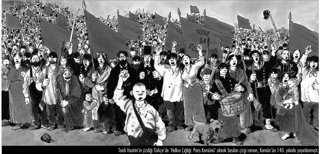
Tardi Vautrin'in çizdiği Türkçe'de 'Halkın Çığı: Paris Komünü' olarak basılan çizgi roman, Komün'ün 140. yılında yayınlanmış.

Diğer önemli nokta Marks'ın işçi sınıfı olarak gördüğü kitlenin hiç de bize klişe şekilde resmedildiği gibi erkek endüstriyel kol işçisi olmamasıdır. Marks için sınıf, emek sömürüsü etrafında şekillenir. İşçi olmak için kendi kaynaklarınıla kendini destekleyecek ekonomik bağımsızlıktan mahrum