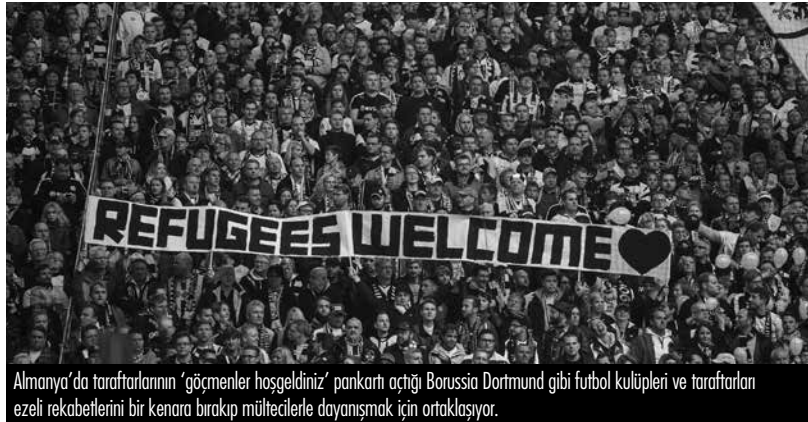
Almanya'da taraftarların 'göçmenler hoşgeldiniz' pankartı açtığı Borussia Dortmund gibi futbol kulüpleri ve taraftarları ezeli rekabetlerini bir kenara bırakıp mültecilerle dayanışmak için ortaklaşıyor.

Davutoğlu'nun "Kayseri pazarlığı" açıklaması, muhalefet partileri tarafından tepkisellik maskesinin ardına saklanmış bir kabul gördü. CHP Genel Başkanı Kılıçdaroğlu, AKP'nin kirli pazarlığına, ırkçılığın dozunu