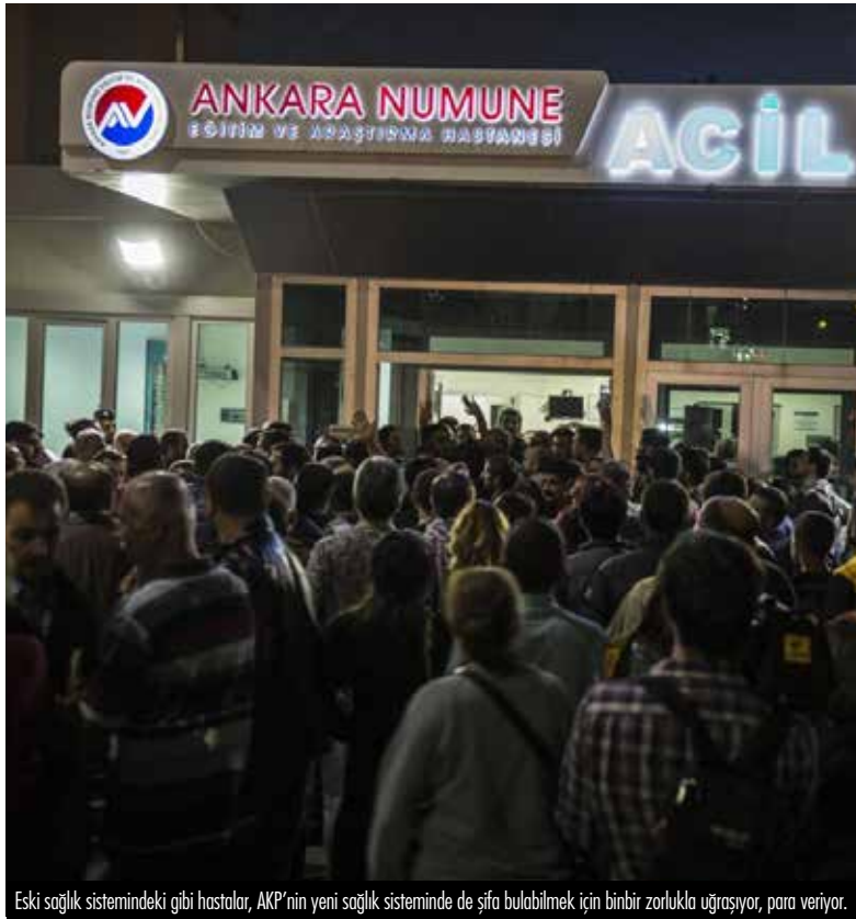
Eski sağlık sistemindeki gibi hastalar, AKP'nin yeni sağlık sisteminde de şifa bulabilmek için binbir zorlukla uğraşüyor, para veriyor.

Sağlıkta özelleştirme hedefine yönelik birinci basamak sağlık hizmetleri sunan Sağlık Ocakları 2004 yılında tasfiye edilerek Aile Sağlığı Merkezlerine çevrilmişti. Bu kapsamda 2004 yılında 5258 Sayılı Aile Hekimliği Kanunu çıkarıldı. Kanun kapsamında ‘Aile hekimliği ödeme ve sözleşme yönetmeliği’ çıkarıldı. Yönetmeliğe göre aile sağlık merkezlerinde çalışan doktorlara ‘cari ödeme’ adı altında bir bütçe verildi. Doktorlar aile sağlık merkezinin kurulması için kiralanan binanın kira, elektrik ve su giderleri gibi her