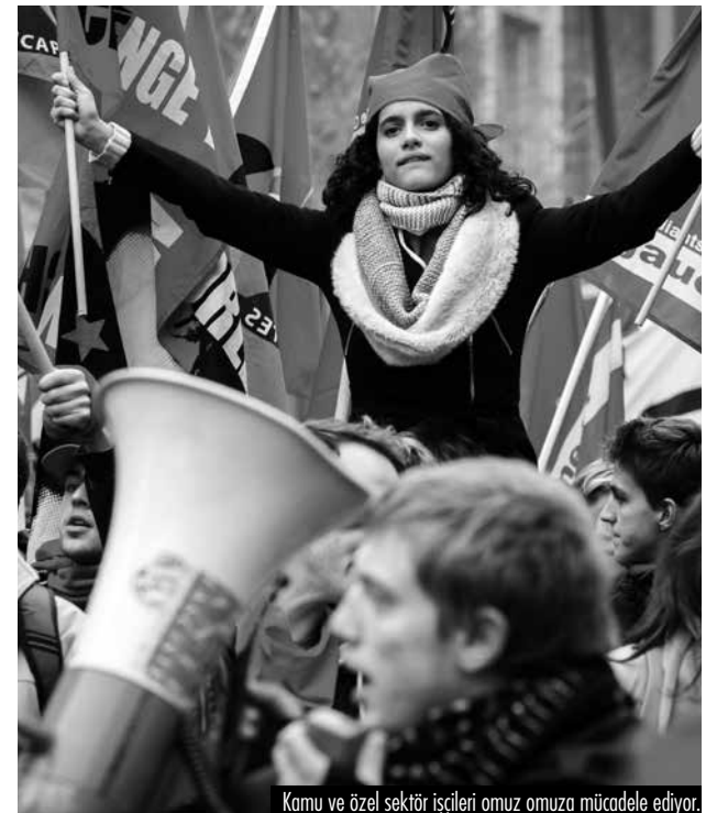
Kamu ve özel sektör işçileri omuz omuza mücadele ediyor.

Hükümet krizin bedelini işçilere ödetmeye çalışırken, küresel pazarda daha iyi rekabet edebilmek için sermaye üzerindeki vergilerin hafifletilmesini savunuyor. Sendikaların bu politikalara karşı 6 Kasım'da yaptığı yürüyüş Belçika'da 2.Dünya Savaşı'ndan sonra gerçekleşen en büyük işçi gösterilerinden biri oldu. Yürüyüşün sonunda polislin göstericilere göz yaşartıcı gaz ve tazyikli su ile saldırması sonucunda 14 gösterici yaralanırken, 30 kişi de gözaltına alındı. Yapılan yürüyüş sendikaların bir aylık eylem programının ilk ayağını oluşturuyor.