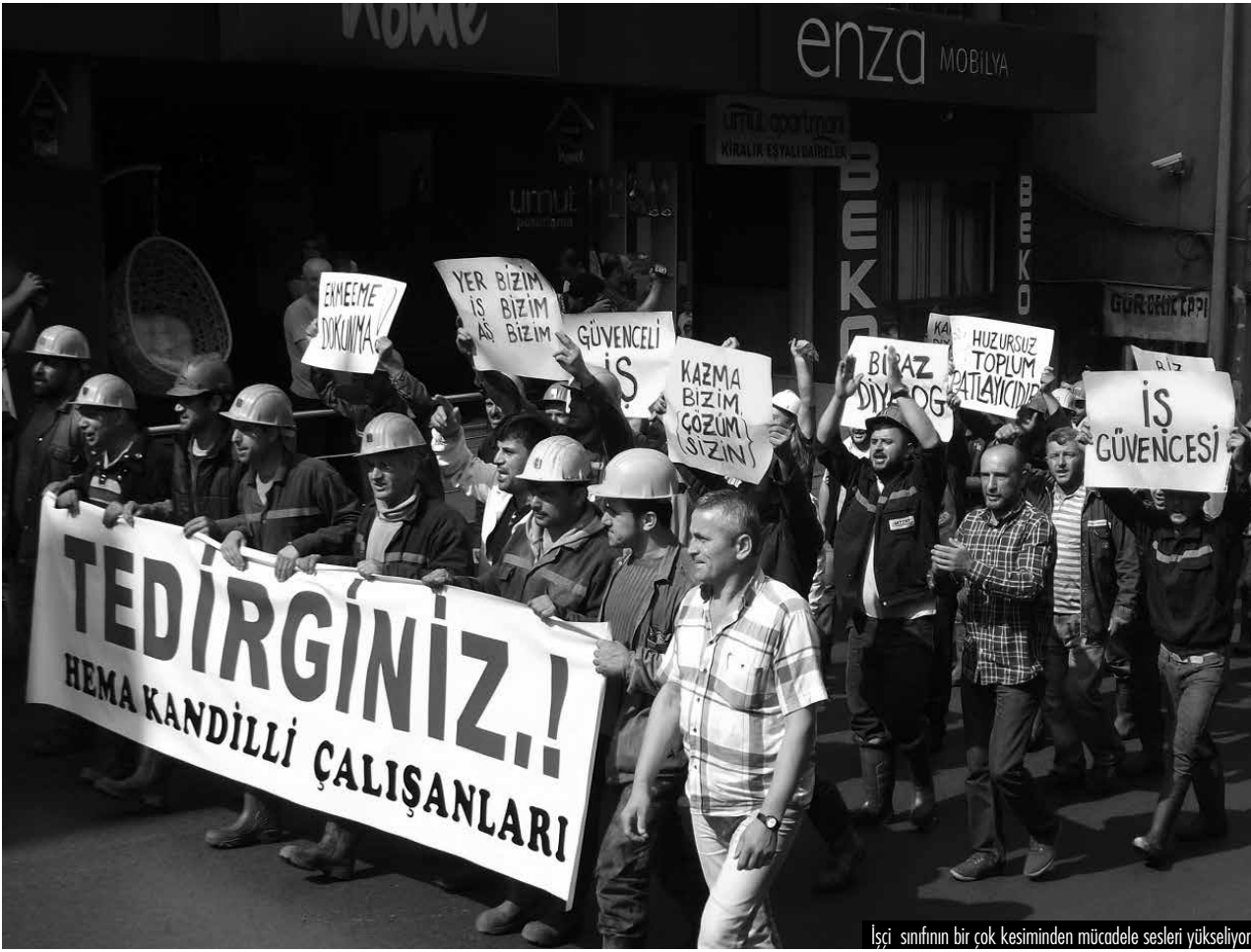
İşçi sınıfının bir çok kesiminden mücadele sesleri yükseliyor.