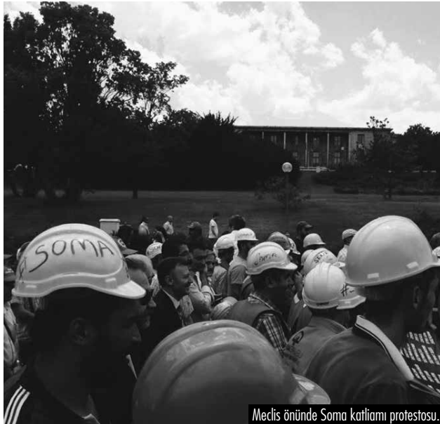
Meclis önünde Soma katliamı protestosu.

■ AKP, Kürtlerin protestolarına karşı devreye soktuğı "güvenlik" yasalarını Ermenek için de uyguluyor. Tüm şehirlerin valiliklerine, Karaman için protesto gösterilerine katılabilecek kişilerin şehirden çıkmalarına müsaade etmemeleri için genelge yollandı. İşçileri öldürmek değil ama öldürenleri protesto etmek yasak.