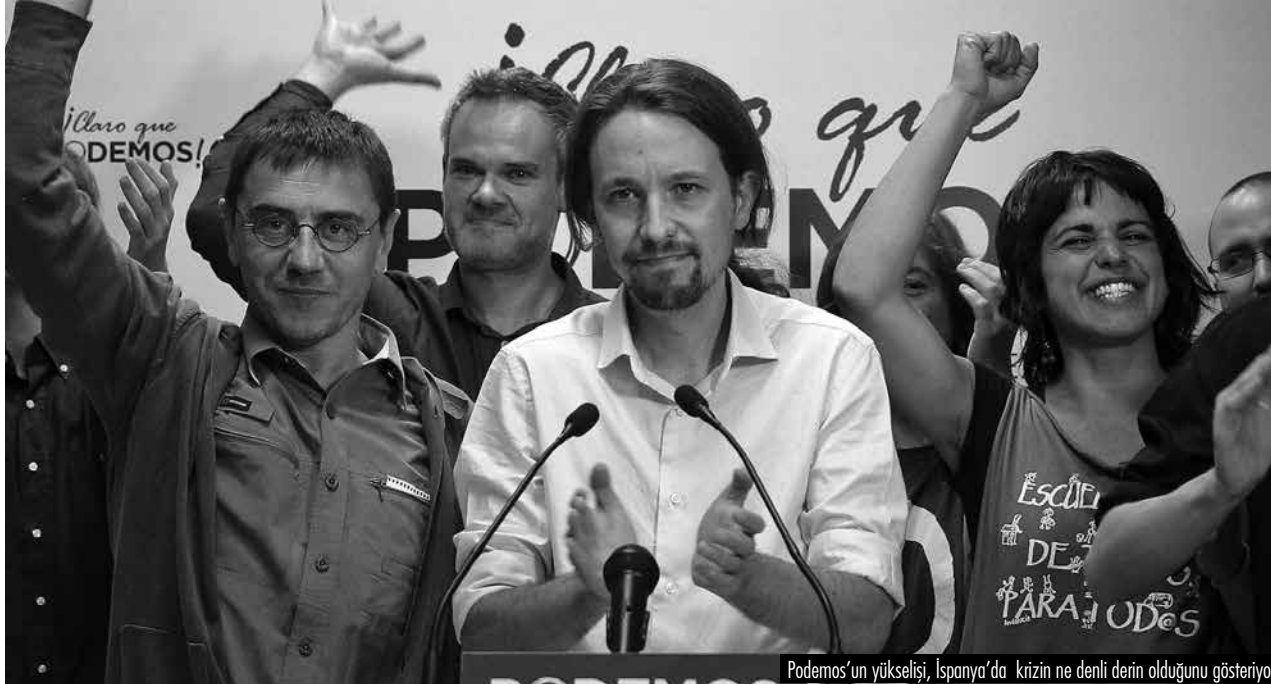
Podemos'un yükselişi, İspanya'da krizin ne denli derin olduğunu gösteriyor.