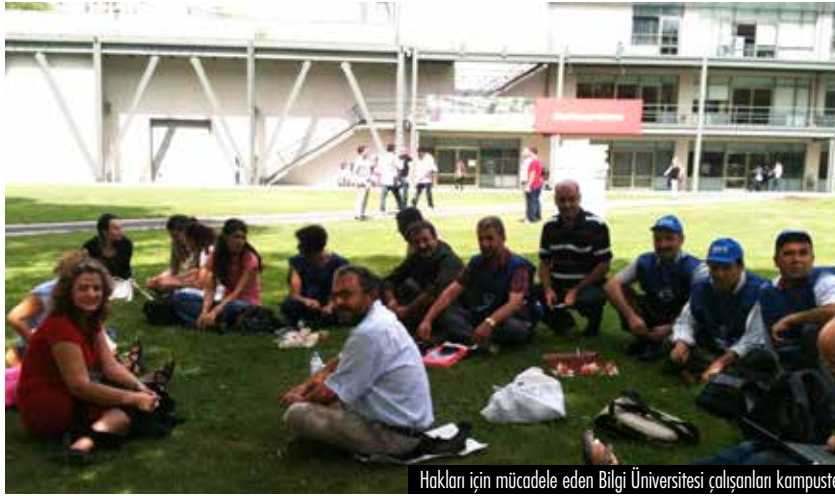
Hakları için mücadele eden Bilgi Üniversitesi çalışanları kampüste.

Bizler sendikalaşmaya öncülük ettiğimiz için işten çıkarılmıştık. İşten çıkarılanların arasından direnmeyi seçenlerin arasında bulunmaktan gurur duyuyorum. Yağmurun soğuşun altında 2010 'da arkadaşlarımız 83