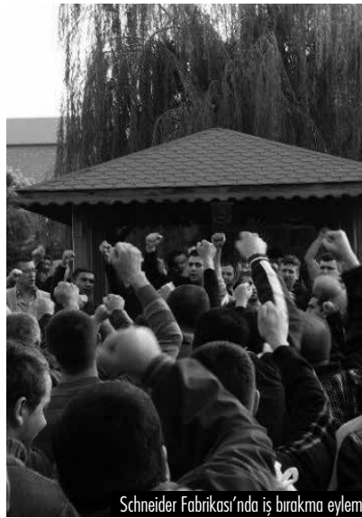
Schneider Fabrikası'nda iş bırakma eylemi.

■ Zonguldak'ın Ereğli ilçesine bağlı Kandilli beldesindeki özel maden ocağında, Torba Yasa gereği geçen ay en az iki asgari ücret alan 850 işçi, bu ay bu yükümlülüğü yerine getirmeyen işverenin geçen ay ödediği ücreti de kestiği gerekçesiyle iş bıraktı.