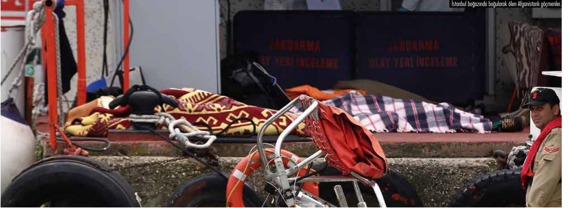
İstanbul boğazında boğularak ölen Afganistanlı göçmenler.