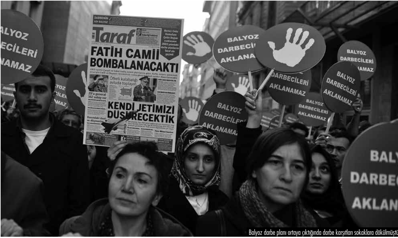
Balyoz darbe planı ortaya çıktığında darbe karşıtları sokaklara dökülmüştü.