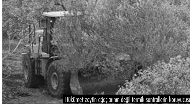
Hükümet zeytin ağaçlarının değil termik santrallerin koruyucusu.

Yırca Köyü'nün 250-300 metre uzağında bulunan zeytinliğin önünde her gün bir araya gelen köylüler gece geç saatlere kadar nöbet tutuyorlar. Şirket, çalışma makineleri ve güvenlik görevlileriyle geldiklerinde onları durdurmak için ellerinden geleni yapıyorlar. Köyün gençlerinden biri, cuma sabaha karşı ağaçları kesmeye başlayan şirket görevlilerinin genç-yaşlı demeden direnç gösteren herkesi dövmeye başlayıp kelepçelediklerini ve alıkoydukları kişileri dağın başına götürüp bıraktıklarını anlatıyor. Zeytinlikte