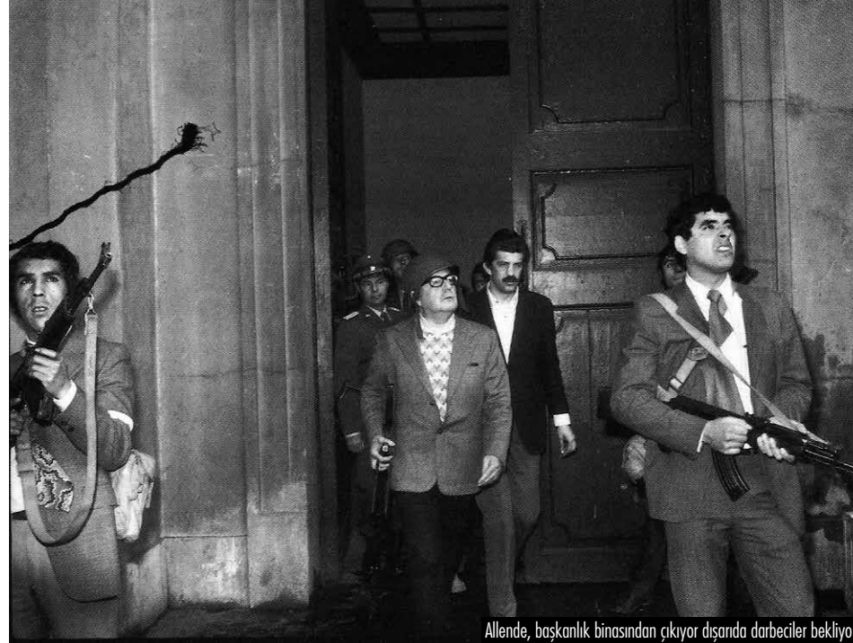
Allende, başkanlık binasından çıkıyor dışarıda darbeciler bekliyor.

Haziran 1972'de Santiago yakınlarındaki Melipilla'da olan olaylar "cordon" isimli yerinden sınıf örgütlenmelerinin ortaya çıkmasını sağladı. Topraksız köylüleri, gecekonduya yaşayan yoksulları, öğrencileri de yer yer kapsayan cordonlar aslen örgütsüz işçi sınıfını örgütleyen alternatif olabilecek iktidar organları sayılabilir. Sosyalist Parti'nin sağ kanadı ve Komünist parti, üyelerine cordonlarla asla işbirliği